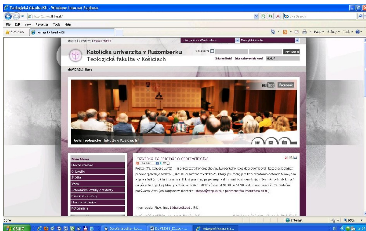
Web stránka Teologickej fakulty

Vzhľad web stránok tf.ku.sk , www.kske.sk , ks.kapitula.sk a www.institutrodiny.sk je na nasledujúcich obrázkoch: