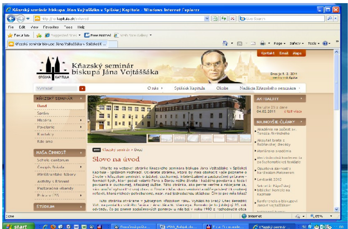
Web stránka Kňazského seminára biskupa Jána Vojtaššáka v Spišskej Kapitule