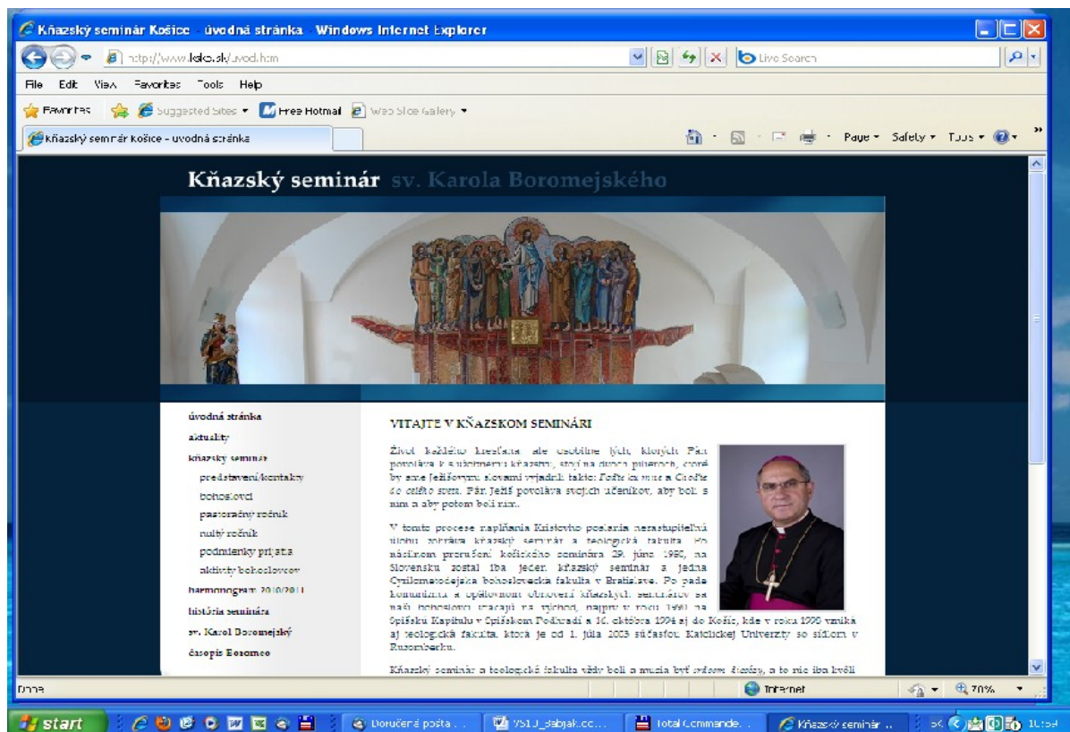
Web stránka Kňazského seminára sv. Karola Boromejského v Košiciach